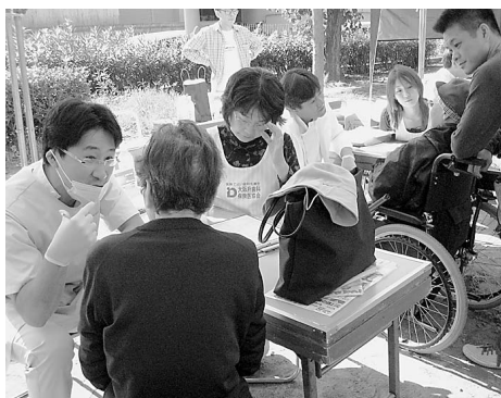
受診者で賑わう健診コーナー =10月28日、大阪市内