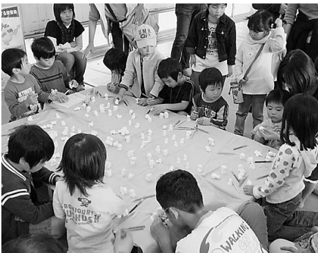
石膏製のキャラクターに色を塗る子ども達 =10月28日、枚方市内