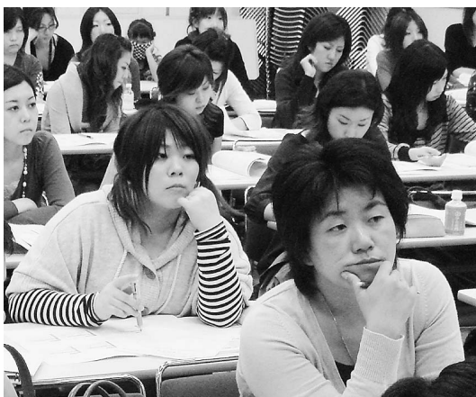
熱心に話に聞き入る参加者 =10月27日、M&Dホール