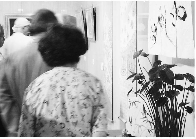
作品に見入る見学者=12日、薬業年金会館

歯科・医科協会の女性医師・歯科医師の会が主催する第15回「余技展」が10日から14日まで、薬業年金会館ギャラリー